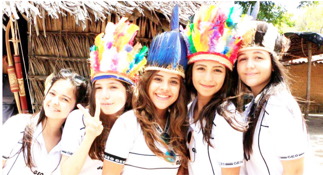
Estudantes do GEO Tambaú durante aula de campo em Barra de Camaratuba