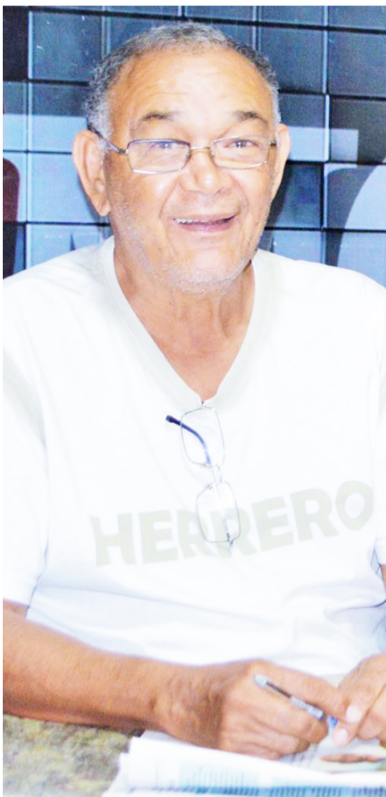
Anchieta está aniversariando hoje