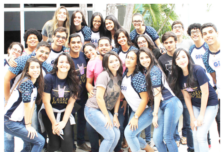
Formandos do GEO Sul em pose para o MQA