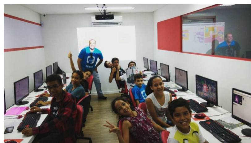
Sala confortável na Super Geeks

SuperGeeks – A SuperGeeks é uma franquia de São Paulo que se instalou em João Pessoa há pouco mais de um ano. Hoje são cerca de 50 unidades no País. Ao final de cada fase será entregue um certificado.